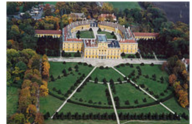
Haydns Wirkungsort Schloss Eszterháza

Lassen Sie sich ein auf ein neues Musikerlebnis, in dem Sie sich selbst und die musikalische Welt Haydns neu erfahren.